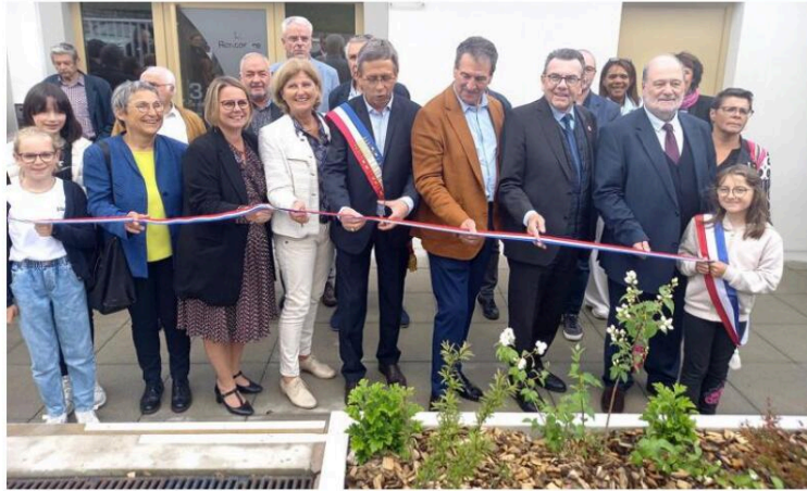
Le maire prêt à découper le ruban.

Après la visite du bâtiment, les invités ont pris la direction du parvis de la salle Victor-Pialat. « Si lors de l'inauguration du Pôle sportif le mois dernier, nous avons évoqué le côté "sport-santé-convivialité", aujourd'hui nous abor-