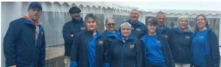
De bleu vêtue, l'équipe du comité des fêtes vous attend le 8 décembre.

Depuis quelques mois, les bénévoles du comité se sont équipés de vestes et de tee-shirts à leur logo pour devenir une vraie équipe d'animations. Et ils en proposent de nombreuses, à l'image du dernier week-end avec la fête au village. La place des Godelons était bien animée dès le vendredi soir où ont été servis 320 repas moules et poulets frites suivis du karaoké de Yann Sylver. Le lendemain, 80 repas ont été vendus le midi. Six équipes se sont affrontées lors de diverses épreuves dans les jeux inter godelons. Dimanche, la fête du village s'est terminée par un concours de boules carrées, mais le temps incertain a fait fuir quelques participants. Les poneys du domaine de Boisse de Valeille ont promené petits et grands autour du village, entre les gouttes d'eau.