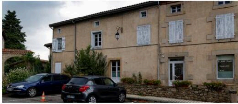
Seul le bâtiment principal sera réhabilité, l'ancien dépôt de la cure (à l'extrême gauche) a été sorti du projet.

Ce projet initié en 2022 était en souffrance depuis quelque temps. Dans un contexte économique difficile, le bailleur social ne pouvait s'engager sur un projet aussi important. Il est donc parti à la recherche de subventions. Le dossier qu'il a déposé auprès des fonds vert vient d'être accepté. Le fonds vert est un dispositif mis en place par l'État et vise à accélérer la transition écologique dans les territoires. C'est l'obtention de cette subvention qui vient de relancer le projet.